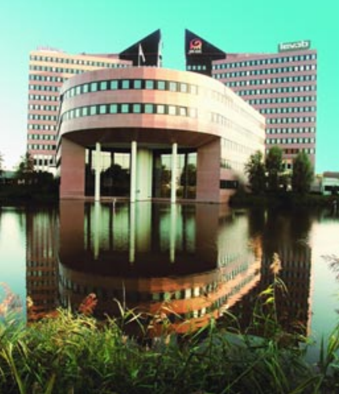
Bolduc-gebouw op De Herven / Bolduc-building at Trade Park De Herven