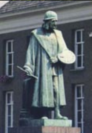
Jeroen Bosch, de wereldberoemde 15e eeuwse schilder, die in 's-Hertogenbosch leefde en werkte. Jeroen Bosch, the famous 15th century painter, who lived and worked in the city