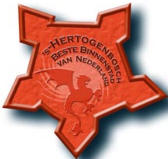
's-Hertogenbosch Beste Binnenstad van Nederland / Award "Best Innercity in the Netherlands"