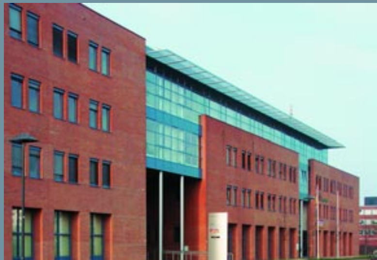
Hogere Agrarische School (HAS) / University of Applied Agriculture