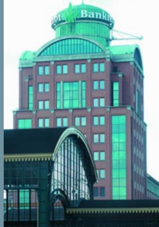
Van Lanschottoren / Building Van Lanschot Bank

Er worden talrijke culturele activiteiten en spraakmakende (sport-)evenementen georganiseerd. De stad bruist volop, hetgeen onder meer blijkt uit de groei van de werkgelegenheid en de vele nieuwe (bedrijfs-)panden. De stad beschikt over een breed scala aan (hogere) beroepsopleidingen en scholingsmogelijkheden. Binnen een straal van 50 kilometer bevinden zich vijf universiteiten. 's-Hertogenbosch kent vele fraaie woonwijken. Met de ontwikkeling van de nieuwe woongebieden, De Groote Wielen en Haverleij, worden hieraan exclusieve woonmogelijkheden toegevoegd dichtbij en deels temidden van bos en natuur.