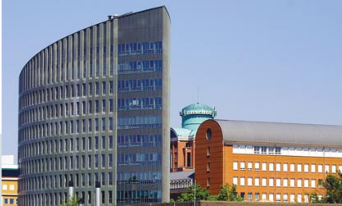
Paleiskwartier / Palace Quarter