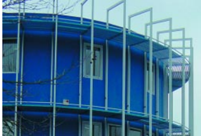
Laboratorium Notox / Laboratory Notox