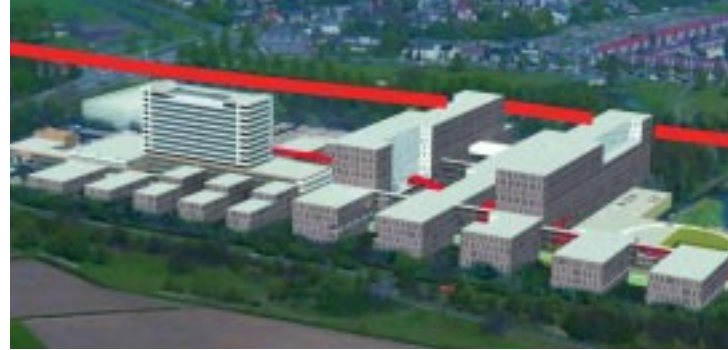
Nieuwbouw Jeroen Bosch Ziekenhuis / New construction Jeroen Bosch Hospital