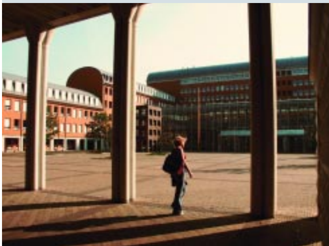
Paleiskwartier / Palace Quarter