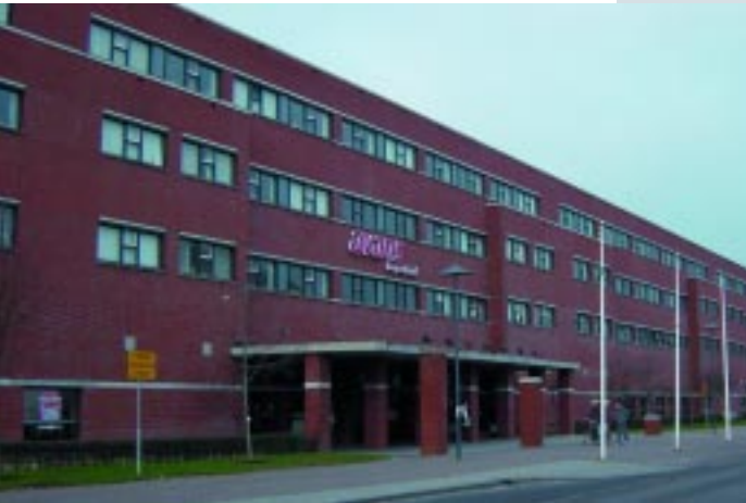
Onderwijsboulevard / Education Strip