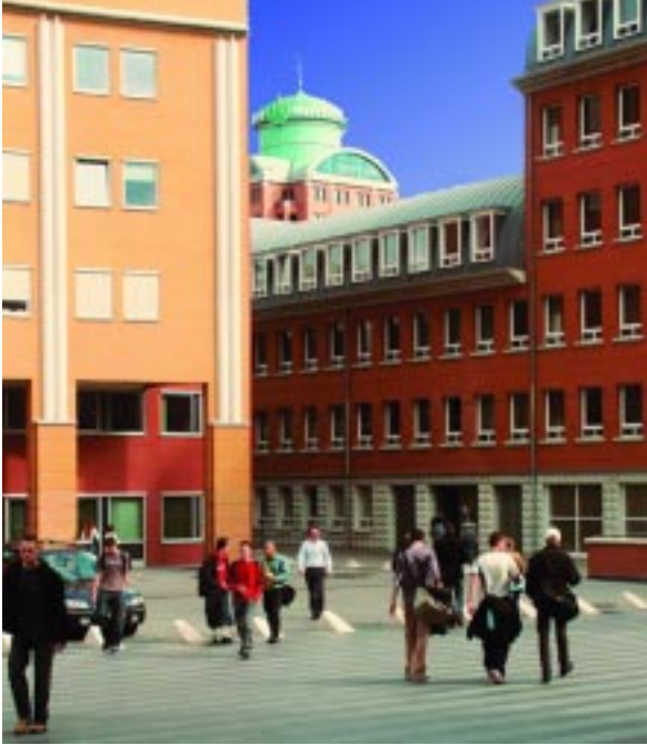
Paleiskwartier / Palace Quarter