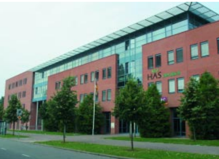
HAS Den Bosch

Voeding en dus ook de voedselproductie en voedselverwerking hebben een sterke relatie met het verbeteren van de menselijke gezondheid. HAS Den Bosch biedt acht gespecialiseerde bachelor en masters-opleidingen die in het teken staan van de agribusiness en voeding. Met moderne laboratoria en onderzoeksfaciliteiten voor biotechnologie, proces-technologie voor voedselbewerking en milieutechnologie, is HAS Den Bosch een toonaangevende instelling. Er wordt gewerkt volgens het principe 'education & development'. Dit houdt in dat onderwijs en bedrijfsleven samen thema's oppakken als ketenvorming in de economie, duurzame ontwikkeling, globalisering en nieuwe technologieën. Omdat de relatie tussen voeding en gezondheid in onze samenleving steeds belangrijker wordt, staat dit thema centraal in het beleid voor de komende jaren. Met HAS KennisTransfer worden kennis en R&D-faciliteiten voor het bedrijfsleven toegankelijk. Het professionele kennisbedrijf levert toegepast en op maat gesneden onderzoek, advies en trainingen. HAS KennisTransfer werkt met bedrijven samen op terreinen als kwaliteitszorg, proces-technologie, life sciences, milieu en energie. Specifieke samenwerkingsverbanden maken de samenwerking voor het bedrijfsleven extra aantrekkelijk.