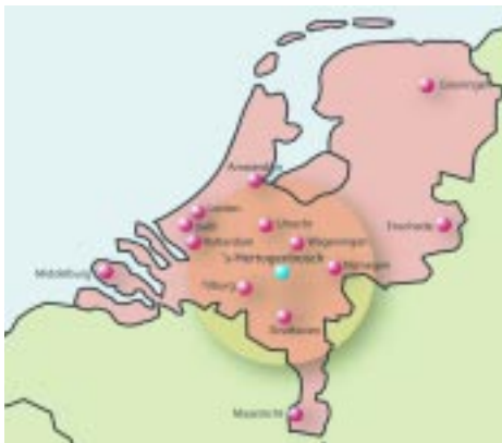
Universiteiten nabij / close to universities

's-Hertogenbosch is op beperkte afstand (maximaal 60 km) gelegen van de universiteiten van Utrecht, Wageningen, Nijmegen, Eindhoven en Tilburg. Dankzij die gunstige ligging beschikken bedrijven op korte afstand over een ongekeerde hoeveelheid kennis, faciliteiten en talent in life sciences, human health, agrifood, medische technologie, management en zorg. Daarnaast kent de stad zelf een breed aanbod van beroepsopleidingen (VMBO, MBO, HBO; totaal circa 22.000 studenten), geconcentreerd aan de Onderwijsboulevard, in het Paleiskwartier en dichtbij de binnenstad en het NS-station. De stad heeft daarmee een goede uitgangspositie verworven voor het opleiden van vakbekwaam personeel en de (bij)scholing van medewerkers van bedrijven.