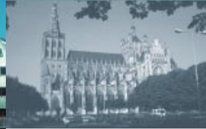
Paleiskwartier / Palace Quarter