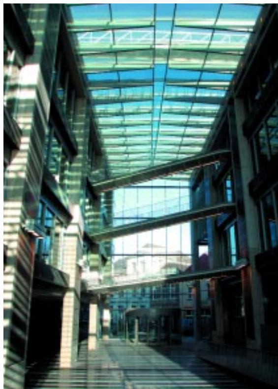
Stadskantoor / City Hall

Geïnteresseerd in vestiging? Bezoek dan de website www.paleiskwartier.nl of neem contact op met de afdeling Economische Zaken.