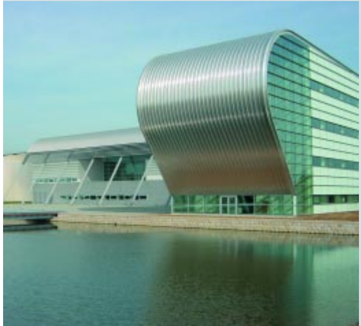
Hoofdkantoor Würth Nederland / Headquarters Würth the Netherlands

Brabant is the most innovative province in the Netherlands. The conditions for business development in and around 's-Hertogenbosch are attractive and the city has a large organisational capacity. In that ideal combination, knowledge institutions and industry work closely together in all kinds of fields. This in turn results in an economic and social spin-off in the form of innovative products and services, new business activity and new applicable knowledge. The key to this fruitful cooperation is the growing clustering of businesses and institutions. Thanks to the improved links between the available knowledge infrastructure and day-to-day business practice, many businesses have already found the way to new sources of knowledge in the region and vice versa.