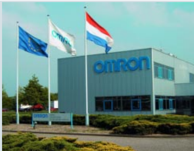
Omron Manufacturing Netherlands

The exchange of knowledge between businesses and institutions in the region is one of the spearheads of the knowledge institutions in 's-Hertogenbosch. This involves lecturers; experienced professionals who use their knowledge and experience in their particular areas of expertise for research and innovation within education and professional practice. These knowledge partners for businesses have created an open learning environment to be able to meet and motivate one another. This learning environment encourages experimentation, delivering performance, gaining experience and the development of ideas. Organisations or businesses that want to share knowledge can approach a lectureship with their assignments for projects or research. Facilities such as classrooms, laboratories, machines and testing facilities are offered at attractive rates. Businesses can use these facilities to test their new inventions, make prototypes or build test setups. There are twenty lectureships, including those in the fields of Enterprise Resource Planning (ERP), gerontology, socialisation of healthcare, and chain and network science. The knowledge institutions in 'sHertogenbosch have developed into a broad knowledge platform for education and business throughout the region.