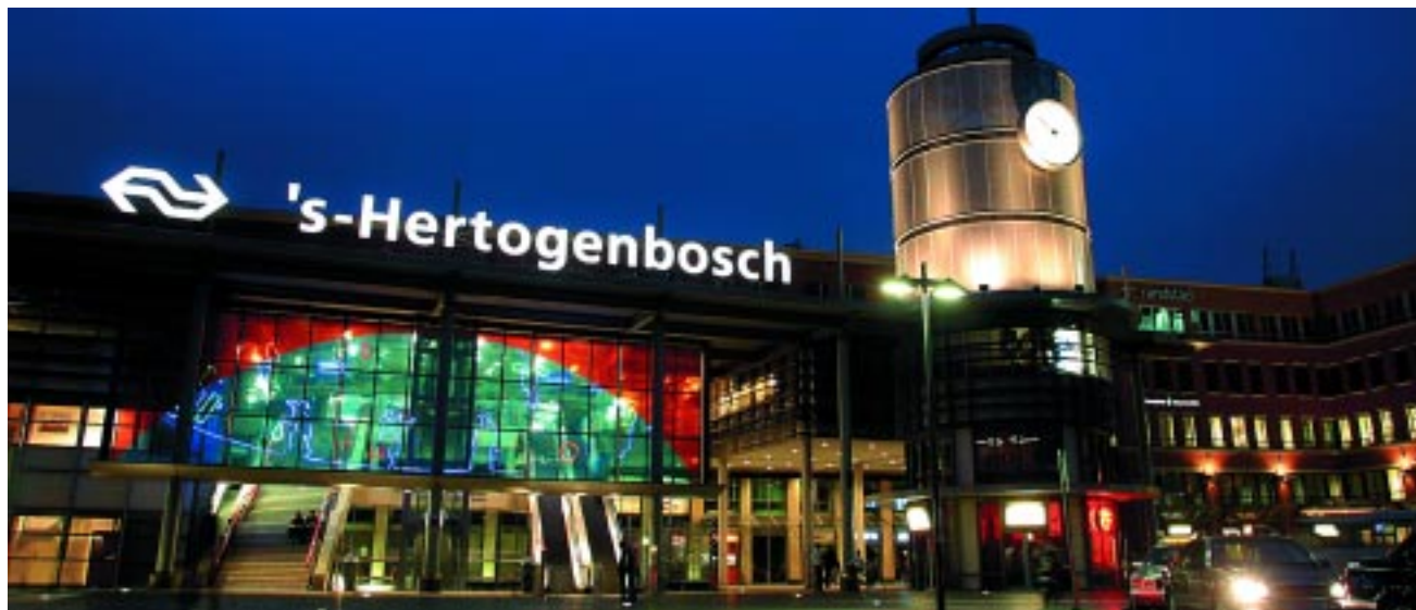
Centraal Station / Central Railway Station

Numerous prominent businesses in the medical sector are already located in the 's-Hertogenbosch region. These include: Philips Medical Systems, GE Medical Systems, Diosynth – Organon, Intervet, Interpharm, Dynadro, BioMérieux, Medica Europe, Omron Manufacturing, Shimadzu Benelux, Fresenius Medical Care, Dirinco, NOTOX, Farmadome, PamGene, Diabetes Direct, Lensvelt Medical, AMPC, SSL Healthcare, Tyco, and Huntley Healthcare.