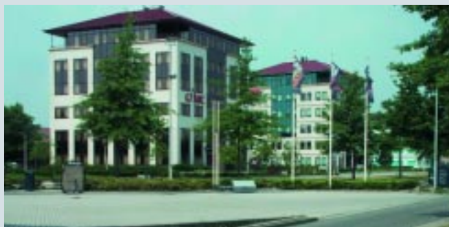
kantoorlocatie / office location Maaspootweg

Are you interested in establishing a business in 's-Hertogenbosch? Then visit the website www.paleiskwartier.nl or contact the department of Economic Affairs.