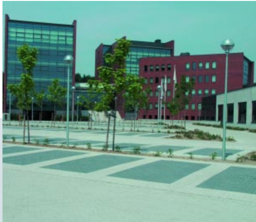
Hoofdkantoor Interpharm / Headquarters Interpharm