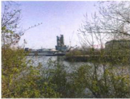
Schip nabij asfaltcentrale, alleen lossen, geen draaiende motor