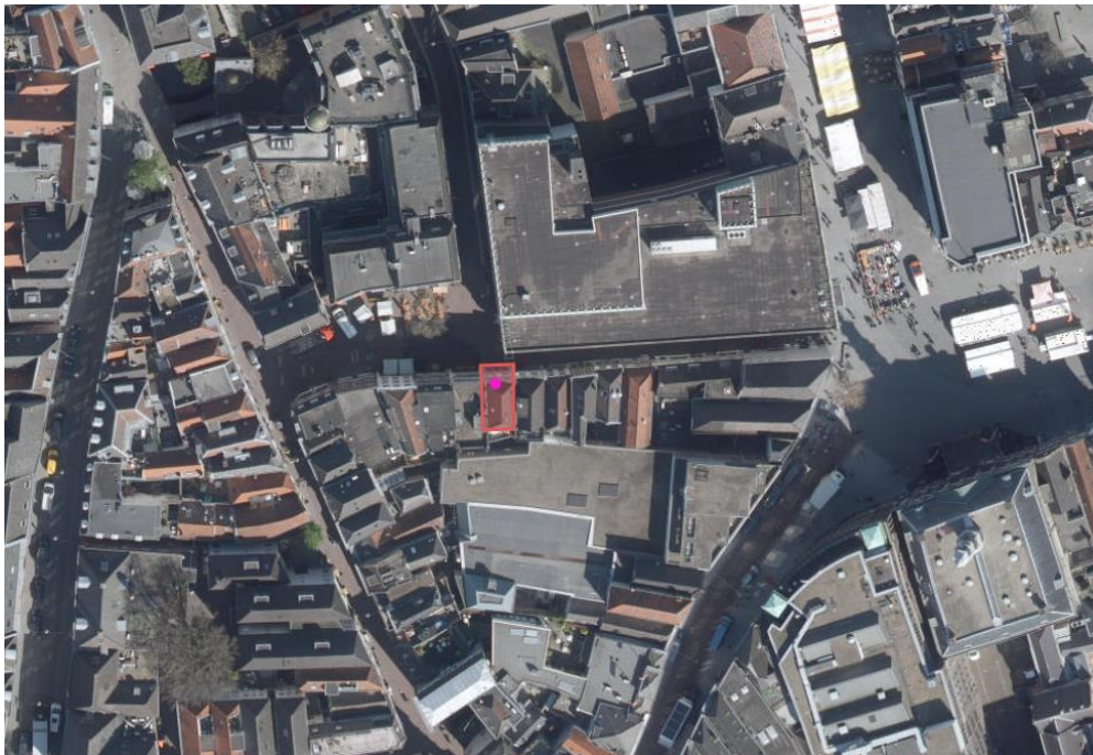
Ligging en globale begrenzing van het plangebied

Het plangebied bevindt zich aan de Minderbroedersstraat 20 in 's-Hertogenbosch. Het perceel is kadastraal bekend als gemeente 's-Hertogenbosch, sectie G nummer 7673. Het plangebied is gelegen in de binnenstad aan/nabij het Minderbroedersplein waar een menging aan functies (horeca, detailhandel en dienstverlening) aanwezig zijn.