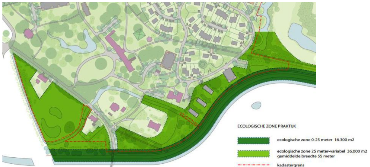
Afbeelding 4 Ecologische zone

De provincie Noord-Brabant zal deze zone toevoegen aan het Natuur Netwerk Brabant nadat deze als natuur is ingericht volgens het inrichtingsplan dat als bijlage bij de regels van het bestemmingsplan 'Coudewater (landgoed en boszone)' is opgenomen. De aanleg van de EVZ is als voorwaardelijke verplichting opgenomen in het bestemmingsplan.