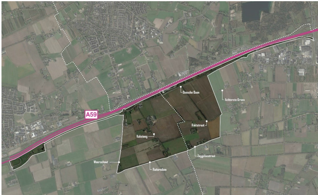
Figuur 1 - Plangebied ontwerpbestemmingsplan Heesch West