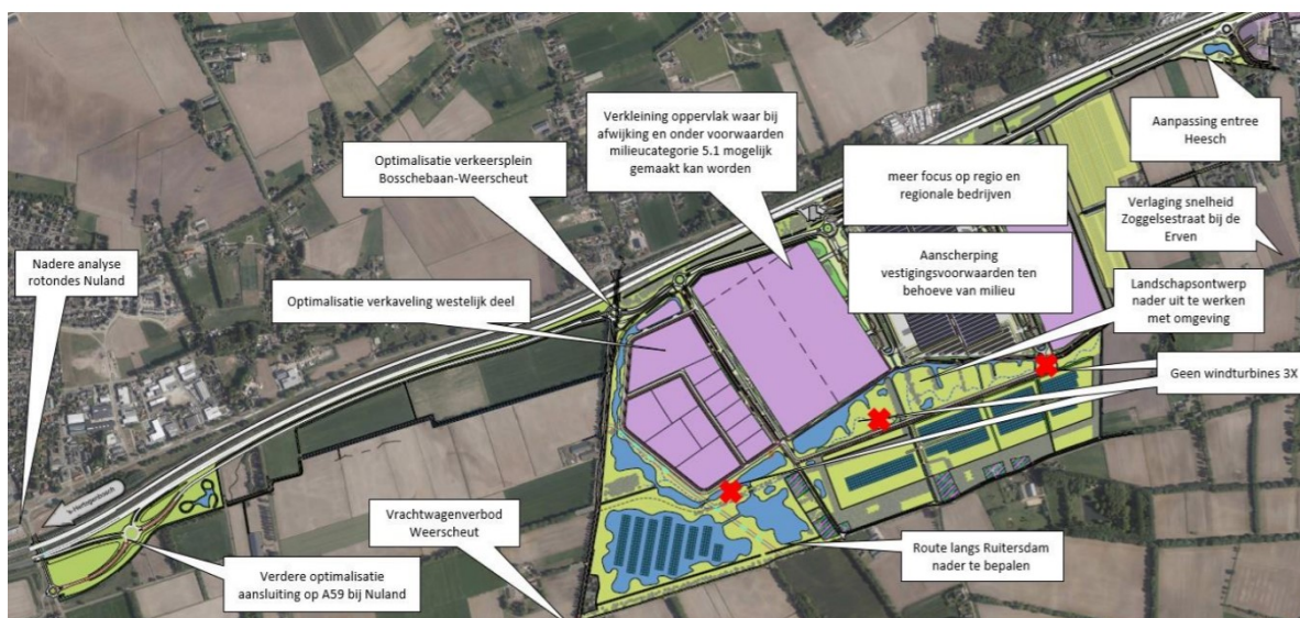
Figuur 3: planaanpassingen