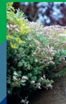
Subsidie Groene daken