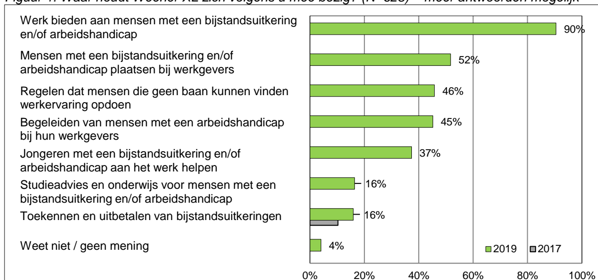
Figuur 1: Waar houdt Weener XL zich volgens u mee bezig? (N=628) – meer antwoorden mogelijk