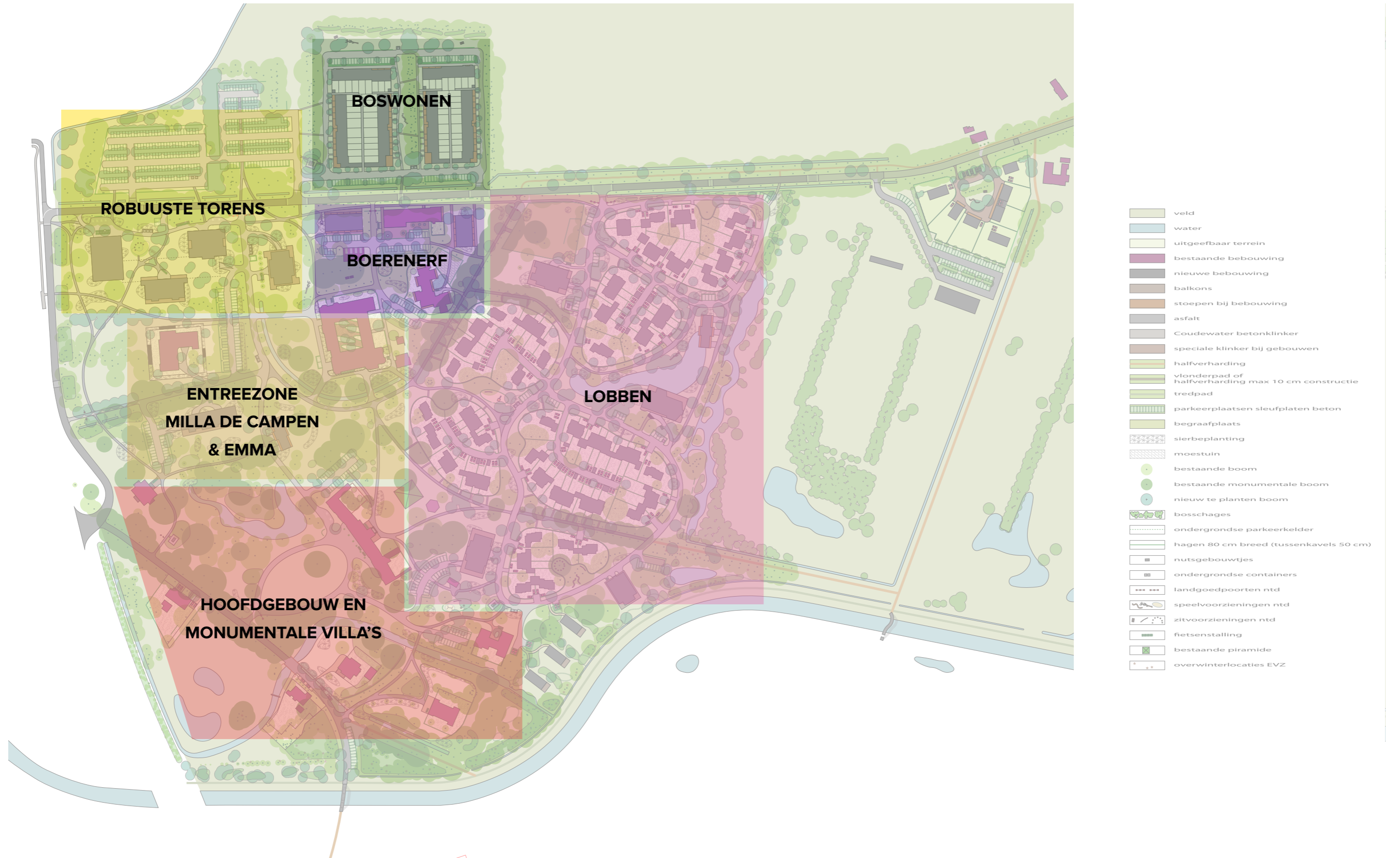
STEDENBOUWKUNDIG PLAN LANDGOED COUDEWATER.