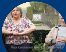
Mien en Stichting Met je Hart BEKIJK HIER ▶