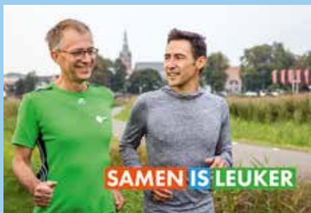
Samen is leuker campagne