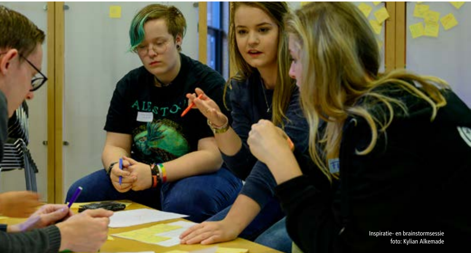
Inspiratie- en brainstormsessie