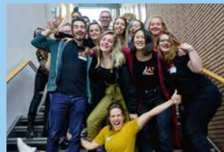
Campagne gericht op jongeren