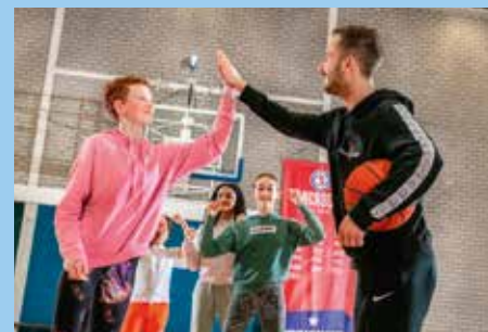
Activiteiten 'Gelijke Kansen'